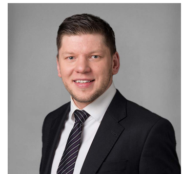
Sebastian Skipper Catering & Partyservice

Partyservice Catering Hausgemachte Wurst- & Fleischspezialitäten Letzigraben 149 8047 Zürich